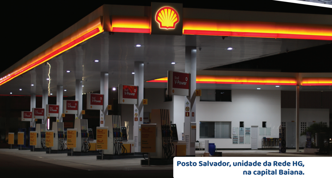
Posto Salvador, unidade da Rede HG, na capital Baiana.