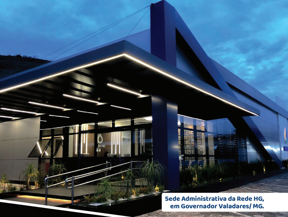
Sede Administrativa da Rede HG, em Governador Valadares/ MG.